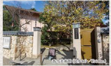
各専有部屋の玄関/約610m