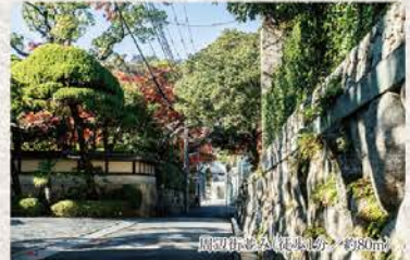
阪急「住吉山手」徒歩5分/約610m

■全体概要◎名称/プラウドシーズン御影住吉山手◎所在地/兵庫県神戸市東灘区住吉山手二丁目1725-15(地番)◎交通/阪急電鉄阪急神戸線「御影」駅徒歩5分、JR東海道本線(神戸線)「住吉」駅15分、阪神電鉄阪神本線「御影」駅徒歩20分◎総戸数/10戸◎用途地域/第一種低層住居専用地域◎建築確認番号/第KS119-6110-01580号(2019年9月13日付)他◎道路/約4.0m、約4.5m、約5m、約6.5m◎構造・規模/木造2階建(2×4)◎設備・仕様/大阪ガス、関西電力、公共上下水道◎売主・販売/野村不動産株式会社西日本支社【国土交通大臣免許(13)第1370号・(一社)不動産協会会員・(公社)首都圏不動産公正取引協議会加盟】〒550-0011大阪市西区阿波座1丁目4番4号(野村不動産四ツ橋ビル15階)TEL.0120-06-655◎設計・施工/株式会社昭和工務店◎販売戸数/未定◎販売予定価格/未定◎敷地面積/122.92㎡~123.93㎡◎建物延床面積/121.94㎡~123.99㎡※ビルトイン車庫含む(ST9,ST10)◎私道負担/あり 216.97㎡(STAGE1~10の10区画で共有)◎間取り/3LDK◎建物竣工時期/2020年3月竣工済◎引渡時期/即入居可◎販売予定時期/2021年3月中旬※記載の敷地面積等は未分譲区画のうち、建築確認取得済の2戸に対してのものです。※販売戸数等の未確定部分につきましては本広告で表示いたします。※引渡時期につきましては、諸手續完了後の入居となります。※現在、当物件は新型コロナウイルス(COVID-19)への感染拡大防止に関する政府の緊急事態宣言、ならびに各自治体からの要請に基づき、営業時間を下記の期間において変更しております。期間:2021年2月8日(月)~3月7日(日)営業時間:平日/13:30~17:00 土日祝/10:00~18:00 定休日:毎週火・水・木曜日(ただし祝日は除く)※今後変更となる可能性がございます。