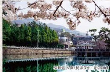
緑地公園/徒歩3分/約200m