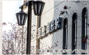
阪急「御影」駅徒歩5分/約380m