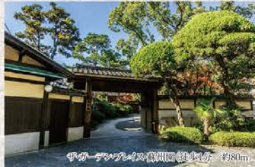
平ガケ「デパレ」の敷地/約80m