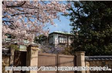
住吉山手/徒歩5分/約610m 駅直結徒歩圏内/約100m