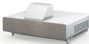
エプソン dreamio EH-LS500W

DLPプロジェクター世界シェアトップBenQの新モデル。約20cm四方の小型モデルながらスクリーンから約1.8mで100インチの4K映像が投写できる。8度までの角度調整と、オートフォーカス、自動台形補正で設置も楽だ。内蔵のLED光源とプレミアム4Kレンズ設定で、20,000時間の長寿命なのも魅力。W19.5×H22.4×D19.5cm、4.1kg。オープン価格（実勢21万円前後）。◎BenQテクニカルサポートセンター ☎0570-015-533