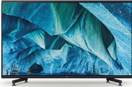
ソニー ブラビア® KJ-85Z9H

8K液晶85V型（インチ）の最高峰モデル。8Kの膨大な画像情報をリアルタイムで処理する高画質プロセッサを搭載したほか、バックライトのLEDモジュールをブロック単位ではなく単独でコントロールすることで際立つ明るさや深い黒を緻密に再現。W191.3×H122.6×D43.2cm（スタンド含む）、75.8kg。オープン価格（実勢196万6000円前後）。◎ソニーマーケティング(株) 買い物相談窓口 ☎050-3754-9555