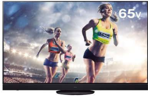
パナソニック ビエラ TH-65JZ2000

8K液晶85V型（インチ）の最高峰モデル。8Kの膨大な画像情報をリアルタイムで処理する高画質プロセッサを搭載したほか、バックライトのLEDモジュールをブロック単位ではなく単独でコントロールすることで際立つ明るさや深い黒を緻密に再現。W191.3×H122.6×D43.2cm（スタンド含む）、75.8kg。オープン価格（実勢196万6000円前後）。◎ソニーマーケティング(株) 買い物相談窓口 ☎050-3754-9555