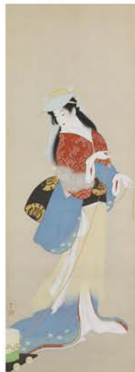
上村松園「沙くみ」(部分) 昭和16年(1941) 岡田美術館蔵

1.最上階に位置するロビーからは、太平洋と伊豆諸島を望む絶景が広がる 2.「Dining & Bar WAVE」のテラスから続くガーデン。水盤の中央には足湯が楽しめるカウンター席があり、リゾートらしい雰囲気の中寛げる 3.大浴場は部屋の温泉とは違った入浴体験ができるよう露天の深湯(水深125cm)となっている。